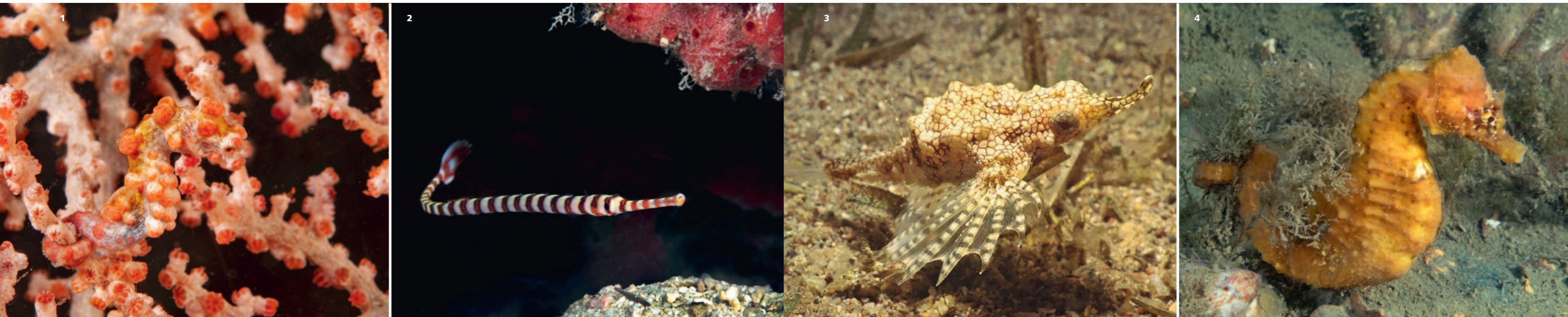
1. Pygmee zeepaardje, Hippocampus bargibanti . 2. Geringde zeenaald, Doryrhamphus dactyliophorus . 3. Kleine drakenvis, Eurypegasus draconis , Sabang. 4. Kortsnuut zeepaardje, Hippocampus hippo . 5. Langsnuut zeepaardje, Hippocampus reidi .